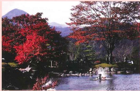
日本庭園 (第1の広場)

御荷鉾(みかほ)の山々を背景に1,500トンもの三波石を用いて大きな池と清流を組み合わせた本格的な池泉回遊式庭園。