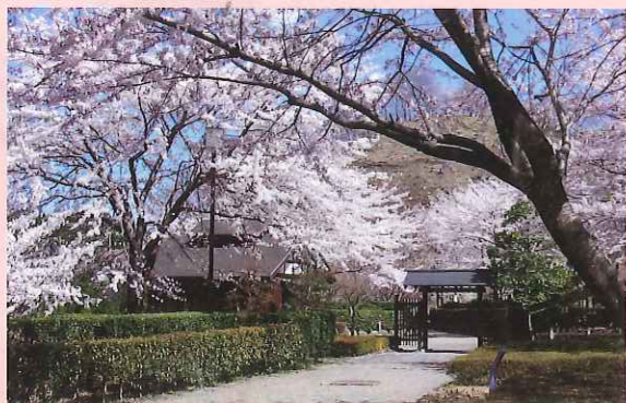
見本庭園 (第2の広場)