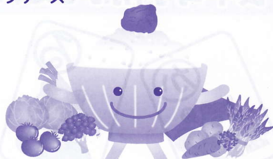
食育推進キャラクター みらいすくん