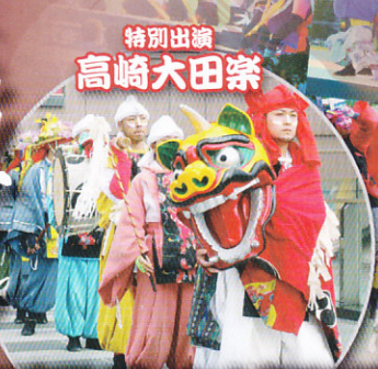
特別出演 高崎大田祭