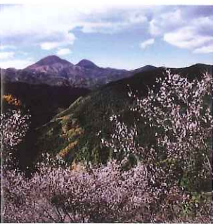
桜山公園から御荷鉾山を望む