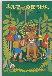
『エルマーのぼうけん』 ルース・スタイルス・ガネット 作 ルース・クリスマン・ガネット 絵 わたなべしげお 訳 福音館書店 1963年