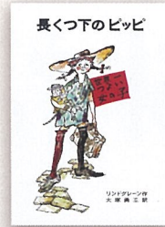
『長くつ下のピッピ』【岩】 アストリッド・リンドグレン 作

初版以来、長きにわたり読み継がれてきた作品をご紹介します。最新ランキングに浮上しなくても子どもの心にきっと届く、素敵な物語との出会いにご期待ください。