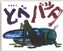
『とべバッタ』 田島 征三 作 偕成社 1988年