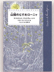
『山賊のむすめローニヤ』【岩】 アストリッド・リンドグレン 作