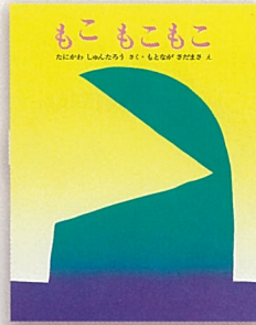
『もこもこもこ』 谷川 俊太郎 作 元永定正 絵 文研出版 1977年