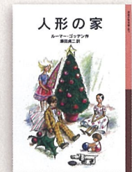
『人形の家』【岩】 ルーマー・ゴッデン 作

このほか会場では時をつむぐ会おすすめの作品をご紹介します。あなたのお気に入りのお話、大好きな場面もぜひ教えてください!