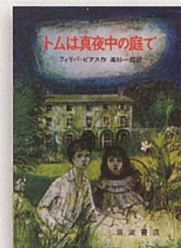
『トムは真夜中の庭で』【岩】 フリリア・ピアス 作