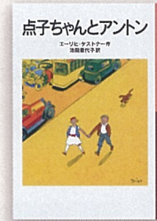
『点子ちゃんとアントン』【岩】 エーリヒ・ケストナー 作