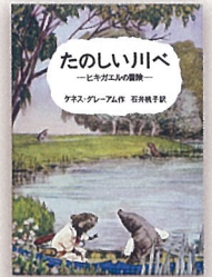
『たのしい川べ』【岩】 ケネス・グレアム 作