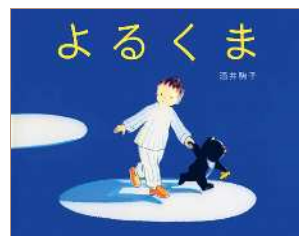
『よるくま』 作・絵: 酒井駒子 1999年 / 偕成社