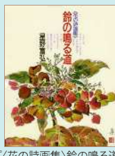
『花の詩画集』鈴の鳴る道』 著: 星野富弘 1986年 / 偕成社

ギャラリートーク・ワークショップ等は、入場料をお支払い いただいた方はどなたでもご参加いただけます