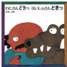
『わにさんどきつ はいしゃさんどきつ』 作・絵: 五味太郎 / 1984年 / 偕成社