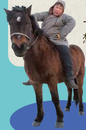
『世界のともだち5 モンゴル』より

偕成社は1936年創業の子どもの本の出版社。『はらぺこあおむし』や「ノンタン」シリーズなどの人気作品を手がけるほか、わらべうた、障がいへの理解を深める本など、時代に先駆けたテーマの絵本や児童書を作り続けてきました。社名の「偕成」には「偕に成る」、読者と偕に出版社も一緒に成長していくという想いが込められています。