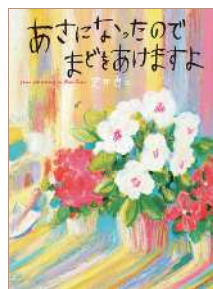
『あさになったのでまどをあけますよ』 作・絵: 荒井良二 2011年 / 偕成社