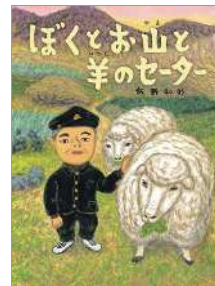
『ぼくとお山と羊のセーター』 作・絵: 飯野和好 / 2022年 / 偕成社