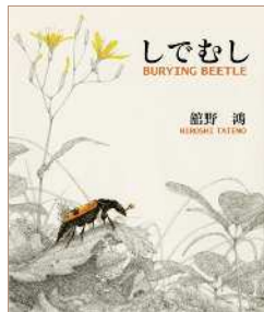
『しでむし』 作・絵: 館野 鴻 / 2009年 / 偕成社