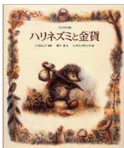
『ハリネズミと金貨』 作: ウラジーミル・オルロフ 絵: ヴァレンチン・オリシヴァンク 文: 田中 潔 / 2003年 / 偕成社